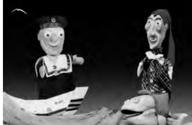
KINDERTHEATER Kasperl am Meer

Fr. | 16. April | 17.00 Uhr | Amthof Festsaal Handpuppentheater für Kinder ab 3 Jahren und die ganze Familie „Kasperl fährt ans Meer“