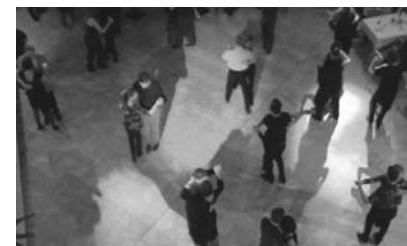
Tango Argentino im stivollen Ambiente des Amthofs