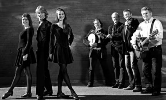
Irish Christmas Festival 2009