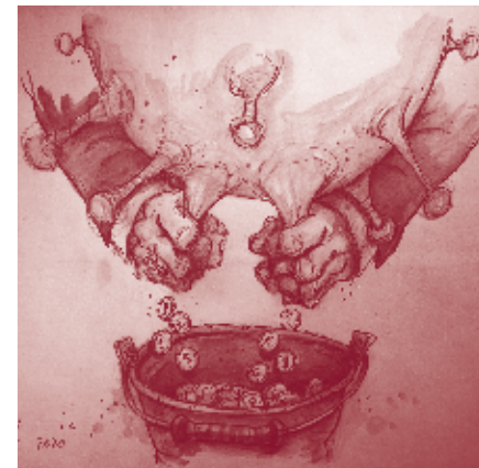
Vernissage ZORAN PETROVIĆ Satire Ausstellung und Präsentation des Quarantäne-Tagebuchs