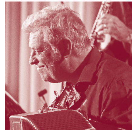
Konzert BELLA CIAO 50 Jahre italienisches Folk Revival mit Riccardo Tesi