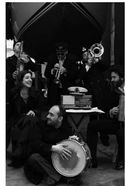
adriatische Musiker zu Gast im Amthof

Die Band setzt sich aus Musikern zusammen, die allesamt aus dem adriatischen Raum stammen und mit vor trefflicher Experimentierfreude die Musiktraditionen und -einflüsse ihrer Herkunftsländer verbinden. Eine gelungene Verschmelzung unterschiedlicher Kulturen, die in grenzenlose Weltmusik mündet. Bei Konzerten nimmt Banda Adriatica das Publikum auf eine stimmungsvolle Reise mit und hebt zu wahren Höhenflügen ab.