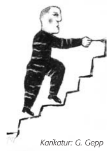
Karikatur: G. Gepp

Mi. | 20. August | 19.30 Uhr | Galerie in der Fachhochschule Satire: Gerhard Gepp Ausstellung bis 15. 9.