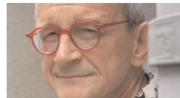
Gert Jonke liest am 25. Juli im Amthof

Fliegen Ich möchte FLIEGEN, ich möchte meine Flügel ausbreiten und abheben, die Welt von oben betrachten, den Boden unter meinen Füßen verlieren, mich vom Wind tragen lassen, der Sonne entgegen fliegen, wie ein Schmetterling durch die Lüfte schweben, dem Himmel zum Greifen nahe sein, mit den Vögeln um die Wette fliegen zu den Sternen und wieder zurück, einfach diese Freiheit genießen. Ich möchte FLIEGEN!