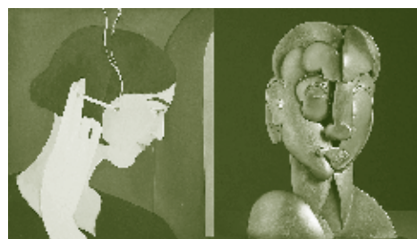
DIE AUSSTELLUNG IST BIS 5. 1. 2013, MI. UND DO: 15-18 UHR, FR: 15-19 UHR UND WÄHREND DER VERANSTALTUNGEN DES KFA GEÖFFNET. (AUSGENOMMEN FEIERTAGE)